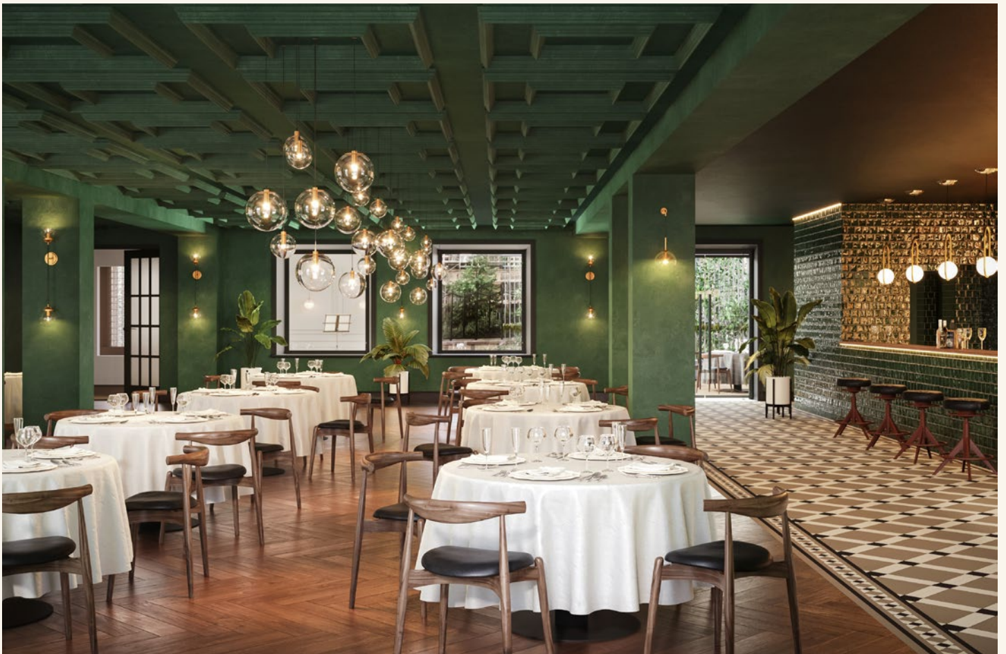
All visualizations and the facilities depicted therein are non-binding and serve illustration purposes only.