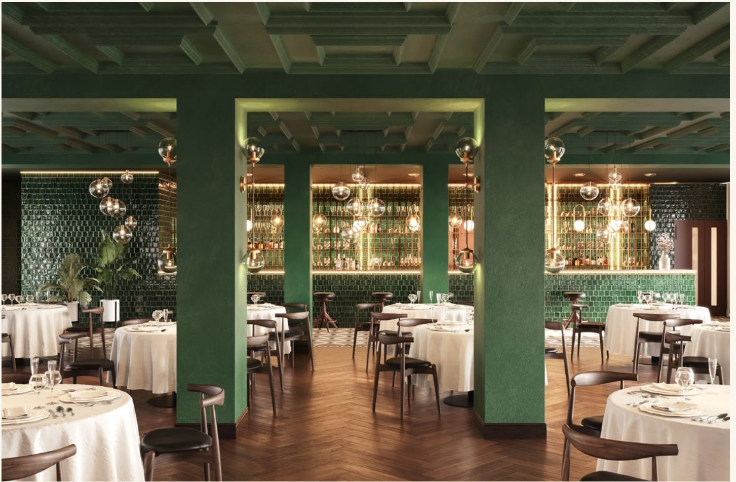
Alle Visualisierungen und die darin dargestellten Einrichtungen sind unverbindlich und dienen Illustrationszwecken.